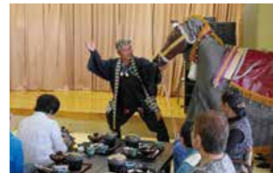
各種イベントで活躍する達者達人

町では農業体験にとどまらず、文化や自然などすべての情報を全国に発信して、来訪者と地元住民の交流を発展させ、将来的には長期滞在・定住してもらうことを目指しています。