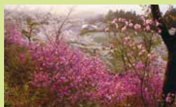
長谷森林公園から見た南部町

達者村には、豊かな自然が織りなす山野や町並み、田園風景など、心癒される景観が数多くあります。眺めることで心が癒され、達者（健康）になれるような優れた景観ポイントを、「達者村百景」として選定し、誇れるビューポイントとして町内外に広く発信し、守り育んでいます。