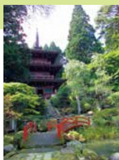
法光寺承陽塔 (三重の塔)