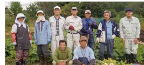
仲間とともに農業技術を習得「達者村リレー農園」