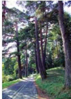
法光寺千本松並木