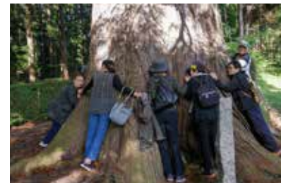
「巨木と歴史探訪」も人気です