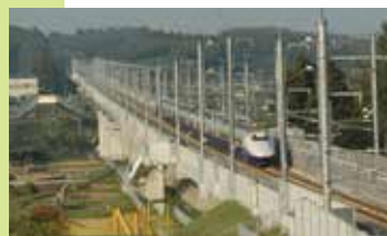
法師岡地区内の橋から見た東北新幹線線路