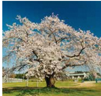
杉沢中学校校庭にある桜の木