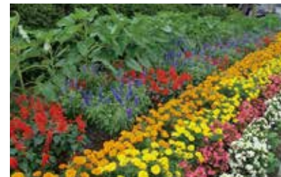
達者村花壇コンクールを実施