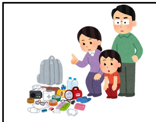
防災資機材の確認