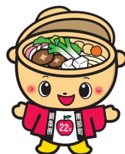
鍋条例キャラクター 「なべまる」