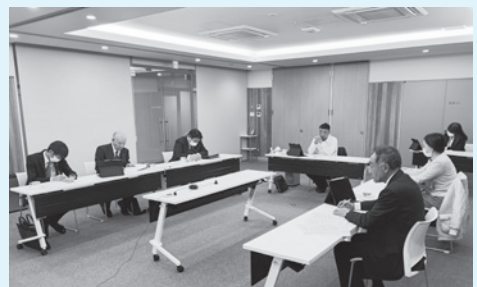
調査テーマについて意見を交わす委員

⇒ また、「生活習慣」と「心と体の健康」の関係性などを調査し、予防的な取組も進めていく必要があると思われる。