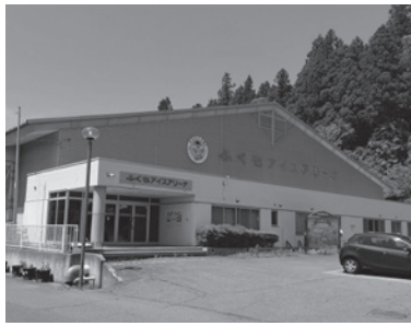
スケートリンクの再開を目指す「ふくちアリーナ」