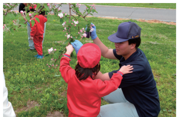
園児と一緒に授粉を行う生徒

ています。また、今後はサツマイモの植え付けや収穫体験も計画されており、次なる交流と豊かな実りの季節が今から楽しみです。