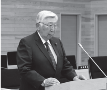
提案理由を述べる西野副議長

▽ 職員等の旅費に関する条例の一部改正に伴い、公務旅行時の旅費を指定職の例に準じること、また、本会議や委員会出席時の費用弁償額の再定義（議長・20000円、議員等18000円※金額の変更はなし）するなど所要の改正を行った。