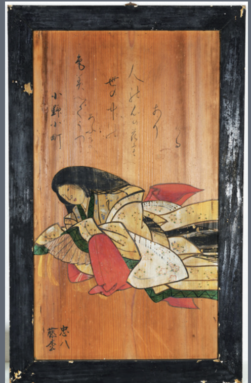
③六歌仙奉納額「小野小町」