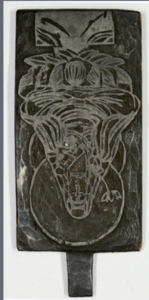
④子安地藏・子安観音の版木