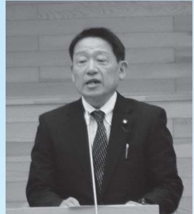
沼畑 俊吉 議員