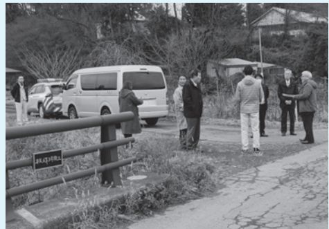
町道白山線・薬師平橋前での調査の様子